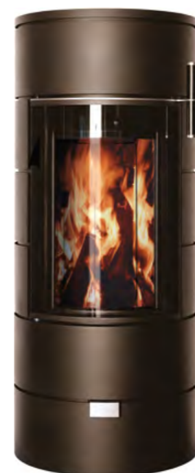
RONDO THERM TITAN mini mocca