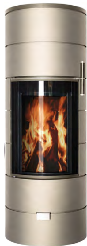
RONDO THERM TITAN midi champagne