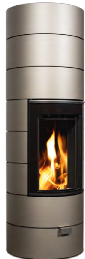
RONDOTHERM TITAN champagne