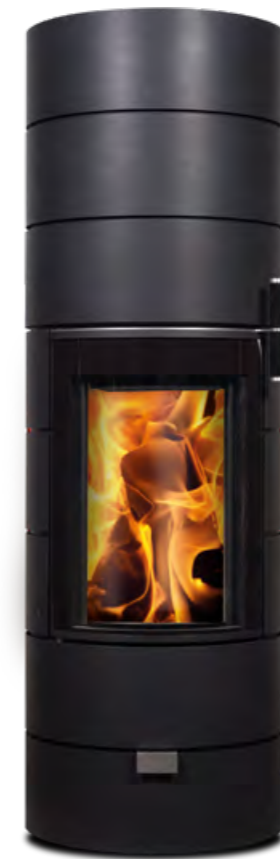
RONDOTHERM TITAN noir