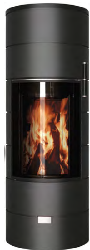
RONDO THERM TITAN midi noir