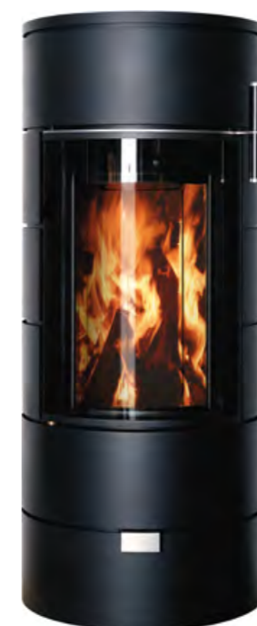
RONDO THERM TITAN mini noir