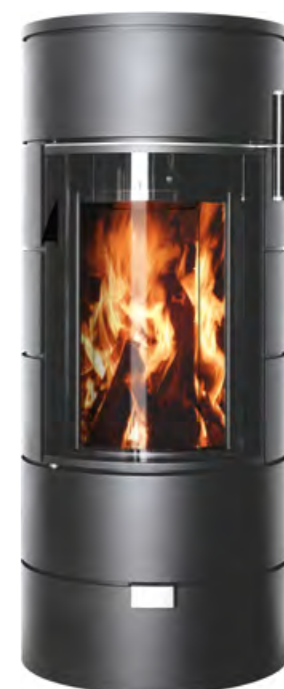
RONDO THERM TITAN mini gris