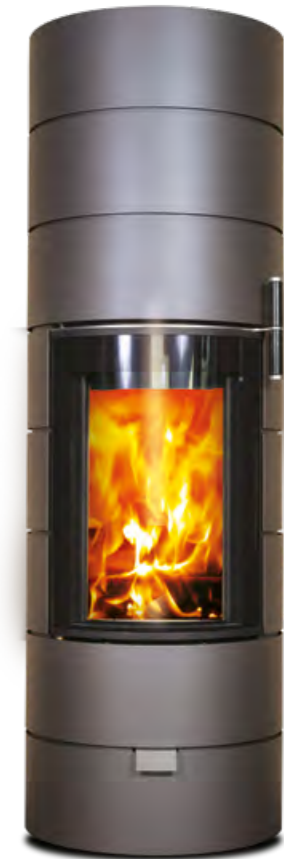
RONDOTHERM TITAN gris