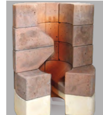
Noyau en argile réfractaire intégré